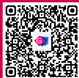
赛逸·展后数据报告